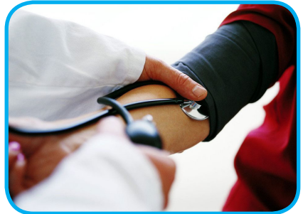
کاهش مصرف نمک، مقرون به صرفه ترین راه حل کاهش فشار خون است

◀ تجربه کشورهای موفق نشان می دهد با کاهش مصرف نمک در جامعه، هزینه های درمانی کاهش قابل توجهی یافته است.